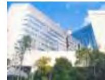
大会会場 神戸国際会議場