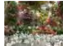
ウェルカムレセプション会場 神戸花園