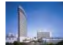
オフィシャルコンgresホテル 神戸ポートピアホテル